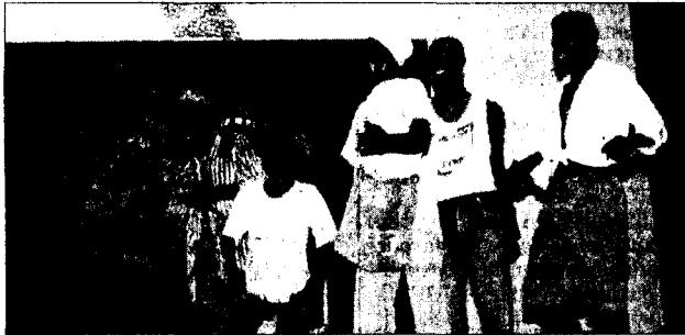
La troupe de théâtre de la MJC - Douala.