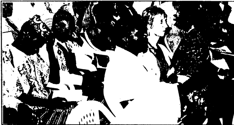
Une vue de l'assistance au cours du colloque "De l'écriture dramatique au jeu scénique".

Les lampions s'éteignent ce mardi 03 juin sur la 6e édition des Rencontres Théâtrales Internationales. Le Centre Camerounais de l'Institut International du Théâtre et le Goethe Institut ont saisi cette occasion pour présenter à l'immense foule de curieux, d'amateurs de la chose théâtrale et de très nombreux étudiants intéressés, une bonne dose d'activités allant du Carnaval des artistes en tenue de scène à travers les rues de Yaoundé, aux débats, tables rondes, conférences et surtout des colloques.